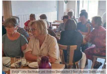
(Fotos: Lotte Bachhuber und Andrea Steinbüchler / Text: Andrea Steinbüchler)