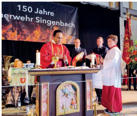
(Text und Foto: Elisabeth Weissen)