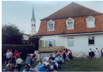
Sommerfest des Kiga Weilach mit Luftschlange. Weilach, 01.07.1989

Die Kinder und das pädagogische Team stecken schon voller Ideen – sie lassen sich für diesen besonderen Anlass etwas Tolles einfallen, um den Tag unvergesslich zu machen.