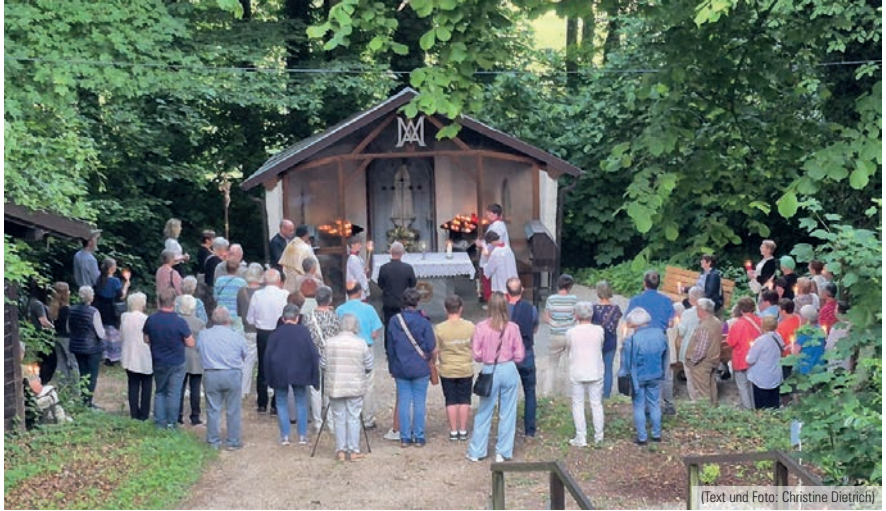
(Text und Foto: Christine Dietrich)