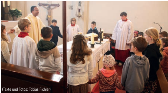
(Texte und Fotos: Tobias Pichler)

ner Projektchor mit feierlichen Liedern umrahmte. Im Anschluss gab es eine lebhaftere Ostereiersuche. Der Osterhase hat für jedes Kind ein Nest versteckt, keines blieb unentdeckt!