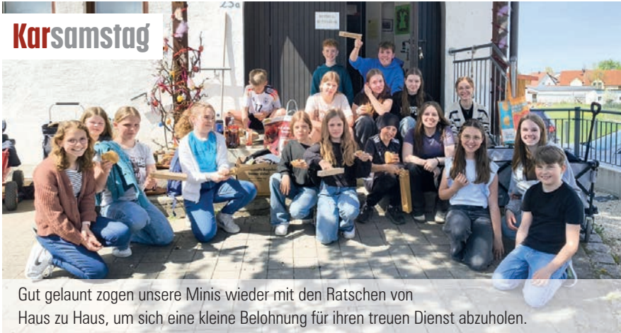
Gut gelaunt zogen unsere Minis wieder mit den Ratschen von Haus zu Haus, um sich eine kleine Belohnung für ihren treuen Dienst abzuholen.